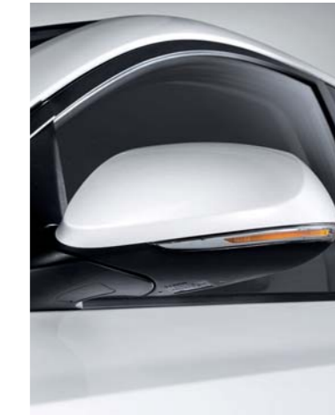
• Luces intermitentes en los espejos retrovisores exteriores