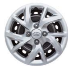
Funda de llanta de aleación de 14 pulgadas