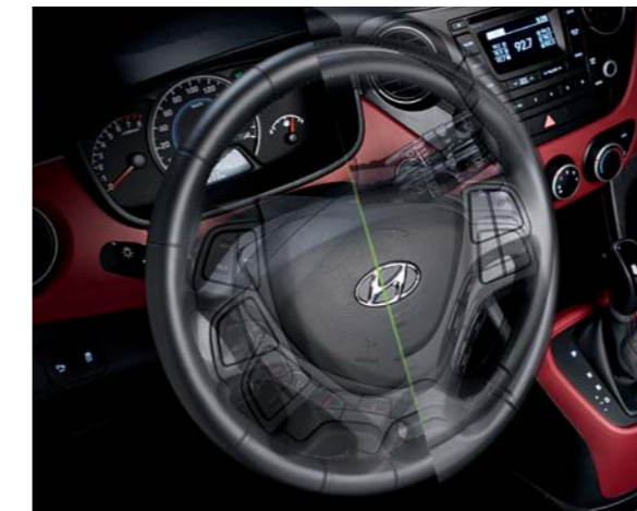
• Columna de dirección ajustable