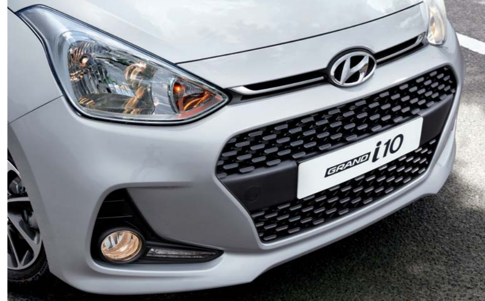
2. Faros envolventes