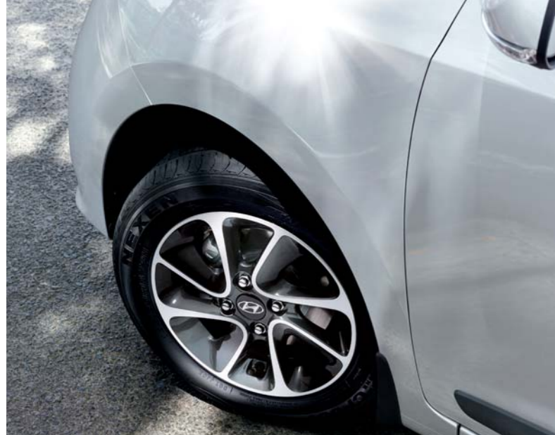
1. Llantas de aleación elegantes