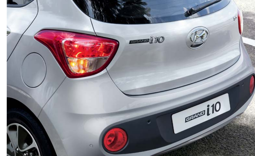
4. Faros posteriores envolventes

En la parte delantera, el Grand i10 cuenta con faros envolventes de cristal transparente cuyos reflectores multifocales se combinan con luces LED de conducción diurna para ofrecer un potente alumbrado. En la parte trasera, el diseño es moderno y elegante: faros de gran tamaño para una visibilidad máxima, pestillo del portón trasero hábilmente oculto tras la H cromada del logotipo, cámara de visión trasera opcional.