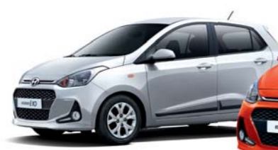
1.25 / 1.0 GL