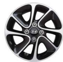
Llantas de aleación de 14 pulgadas (dos tonos)