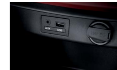
• Reproductor de audio • Conector auxiliar para iPod® y USB