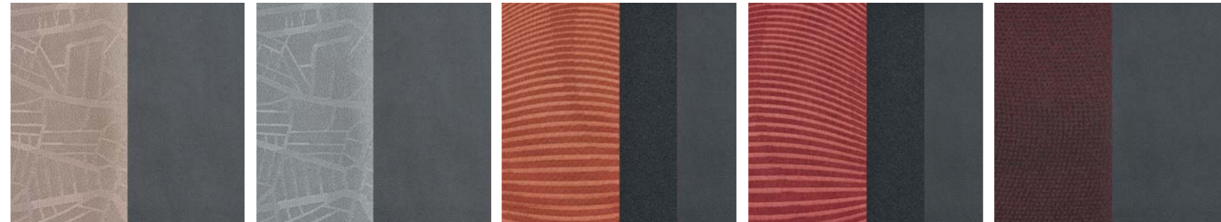
Tela + PVC