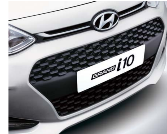
• Nueva rejilla en cascada