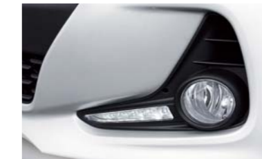
• Faros antiniebla traseros • Luces LED de conducción diurna