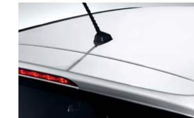
• Cámara trasera • Microantena de techo