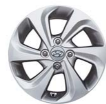
Llantas de aleación de 14 pulgadas (plata claro)