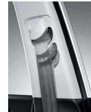
• Cinturón de seguridad ajustable en altura