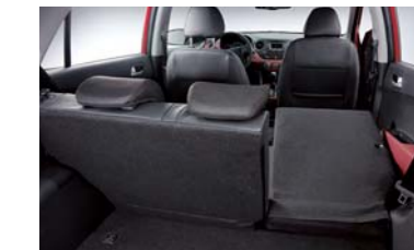
• Retrovisor electrocromático (ECM) con pantalla de visión trasera • Asiento trasero modulable 60/40