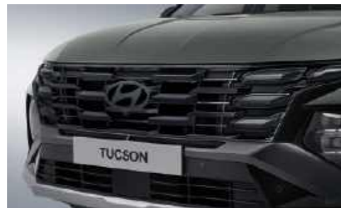
Parrilla del radiador cromada oscura (Luces de conducción diurna con Iluminación Oculta)