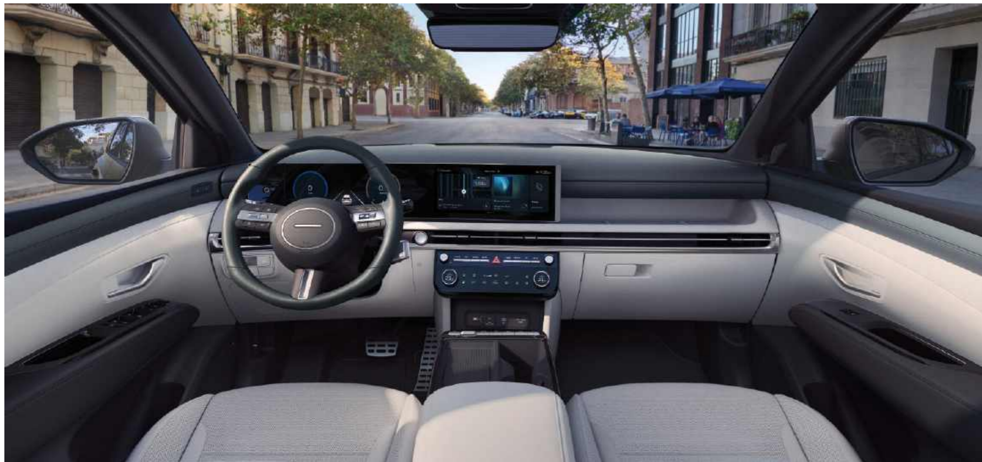
Diseño de arquitectura envolvente

El amplio diseño horizontal de la cabina envuelve el interior, rodeando a los pasajeros con una arquitectura fluida que integra tecnología y estilo.