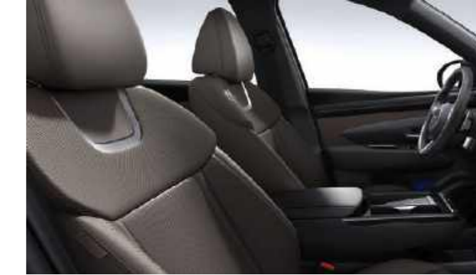
Cuero de color marrón