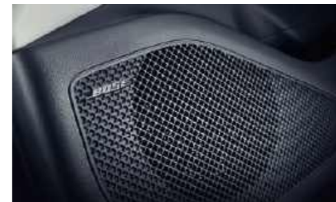
Sistema de sonido premium BOSE