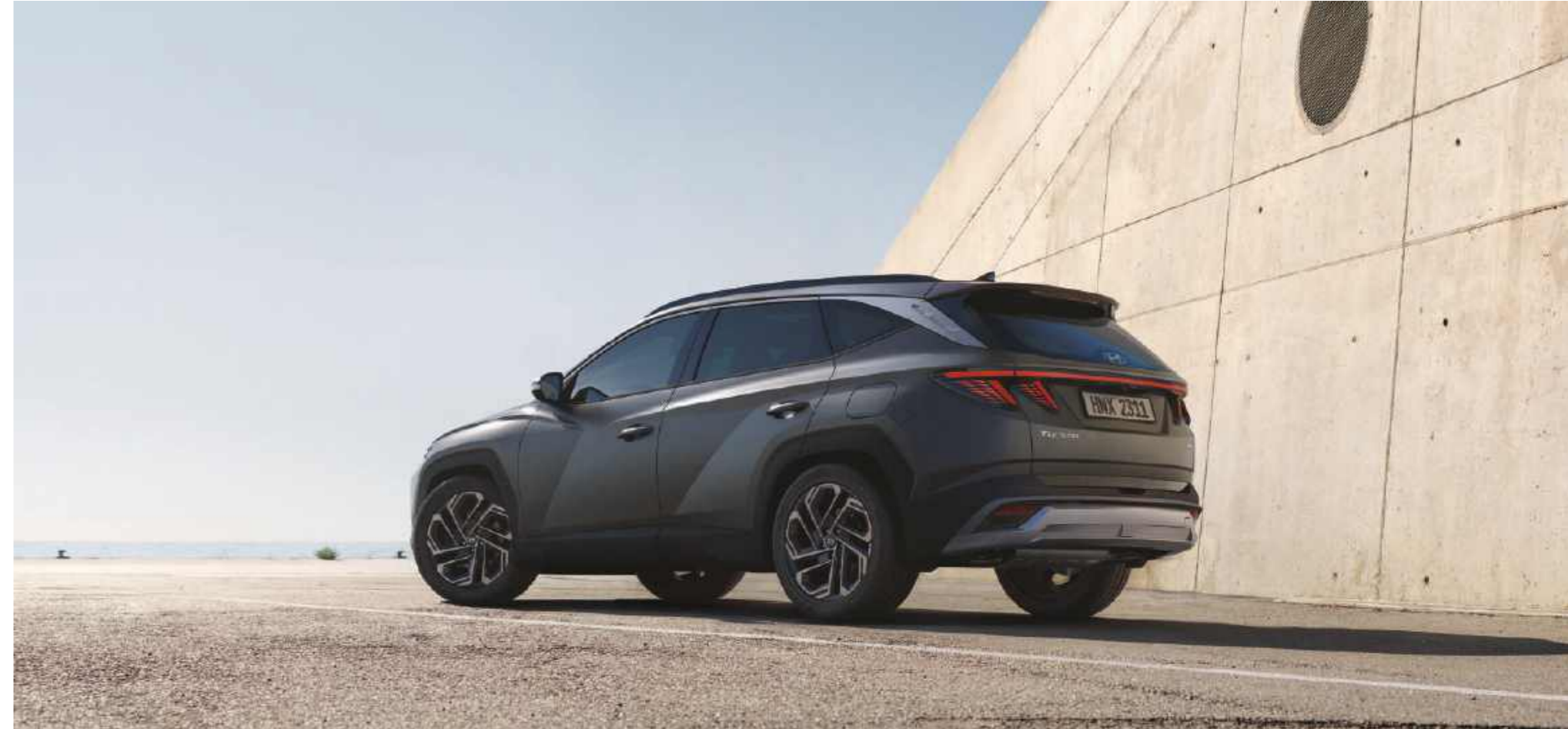
Luces traseras combinadas tipo LED / Parachoques trasero / Superficies en forma de joya paramétrica