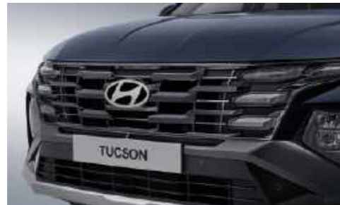
Parrilla del radiador con pintura metálica oscura luces de conducción diurna (Clear Type DRL)