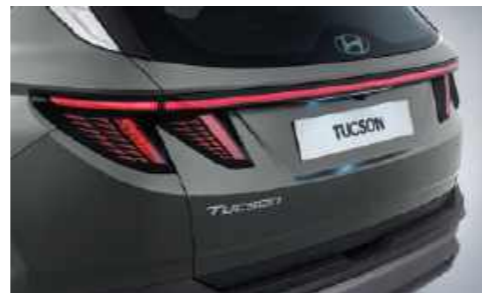
Luces traseras combinadas tipo LED