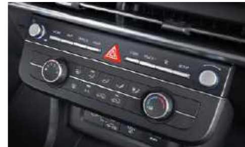
Aire acondicionado manual