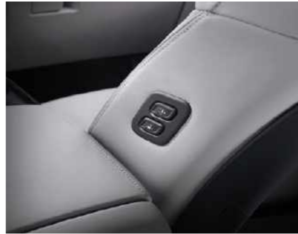
Asiento con memoria de posición integrada Botón de ajuste de posición en el asiento pasajero