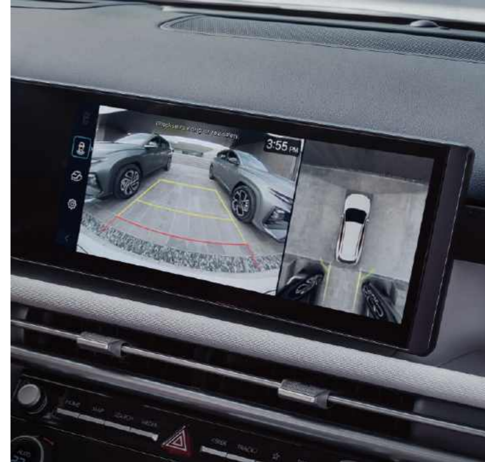
Monitor de vista periférica (SVM)