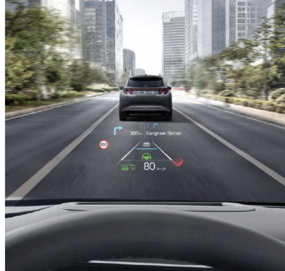
Pantalla de proyección superior integrada (HUD) de 12 pulg.