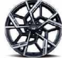
Llantas de aleación de 19" (N Line)