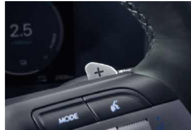
Funciones exclusivas del híbrido Paleta de cambio-Modo de frenado regenerativo