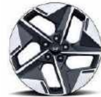
Llantas de aleación de 18" (Opcional)