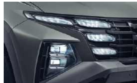
Faros tipo LED completos (Amplia proyección con Sistema Inteligente de Iluminación Frontal)