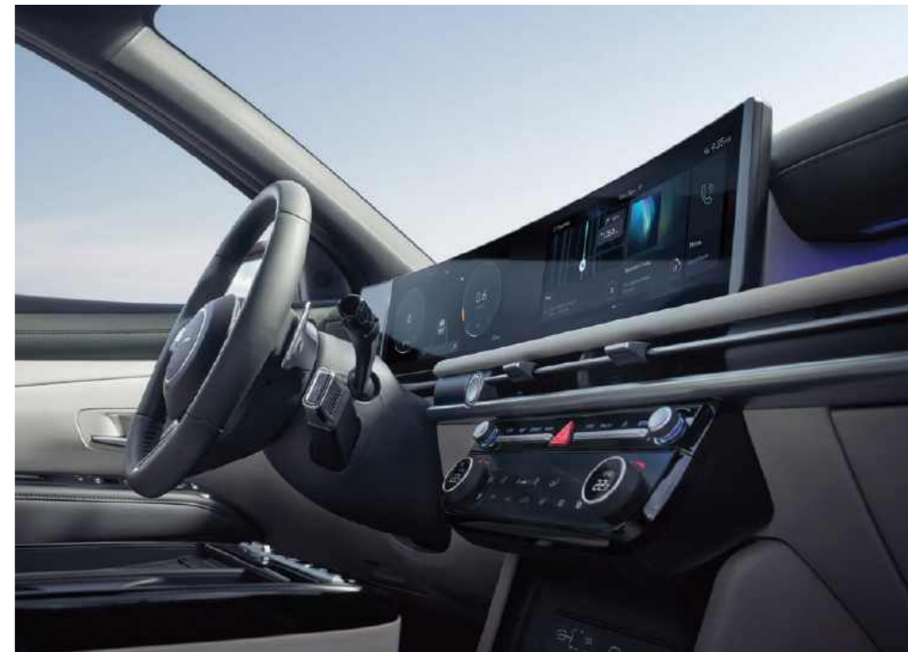
Pantalla curva panorámica de 12.3 pulgadas (Tablero) + 12.3 pulgadas (AVNT)