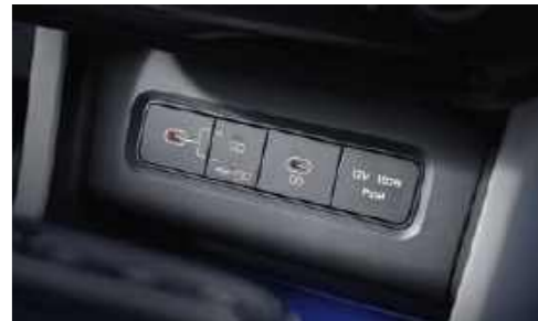
Puertos de datos/carga USB-C