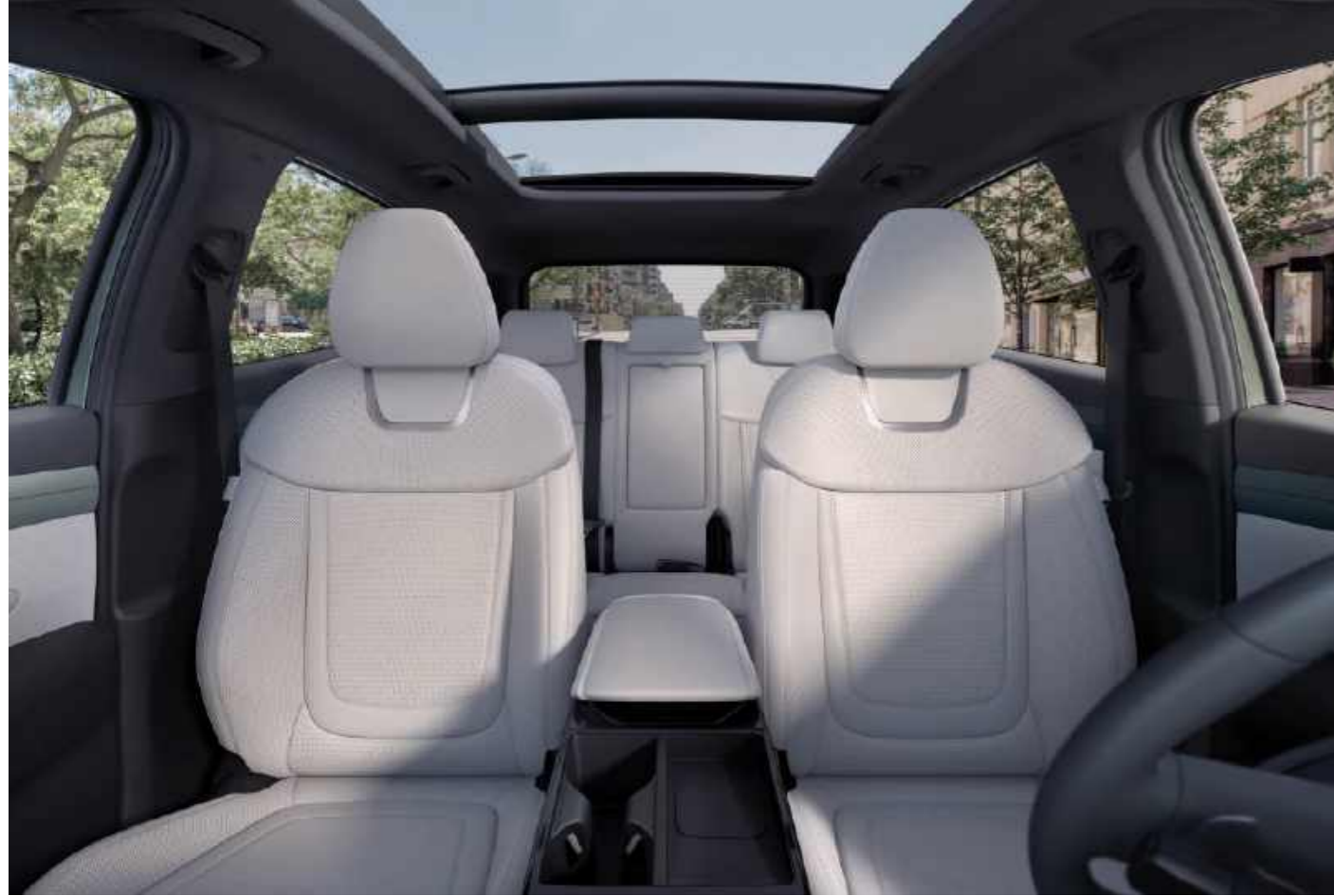
Asientos en primera y segunda fila

Abra espacio para más. Con el mejor espacio de carga en su clase, el amplio interior favorece a los variados estilos de vida y actividades, ofreciendo más versatilidad que nunca.