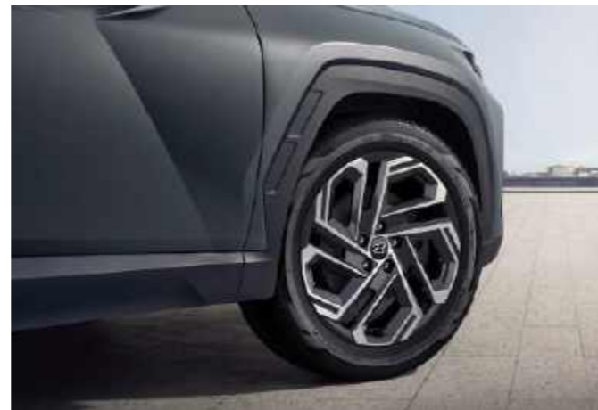
Barras de techo / Techo corredizo panorámico Lantas de aleación de 19 pulgadas