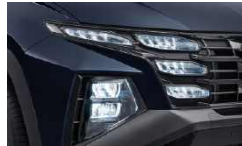
Faros delanteros tipo LED completos (Tipo MFR)