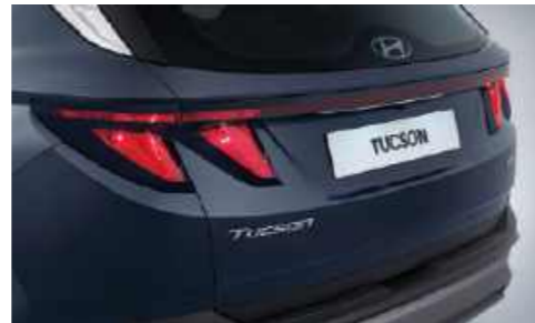
Luces traseras combinadas tipo halógenas