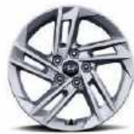
Llantas de aleación de 17" (Estándar)