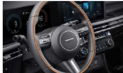
Volante con calefacción