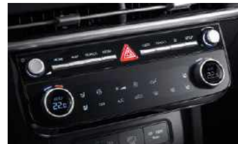
Sistema de aire acondicionado totalmente automático