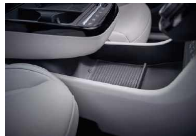
Luz de ambiente configurable / Multibandeja Consola tipo flotante