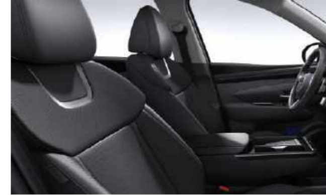
Cuero negro en un tono