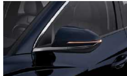
Intermitentes tipo LED integrados en los espejos retrovisores