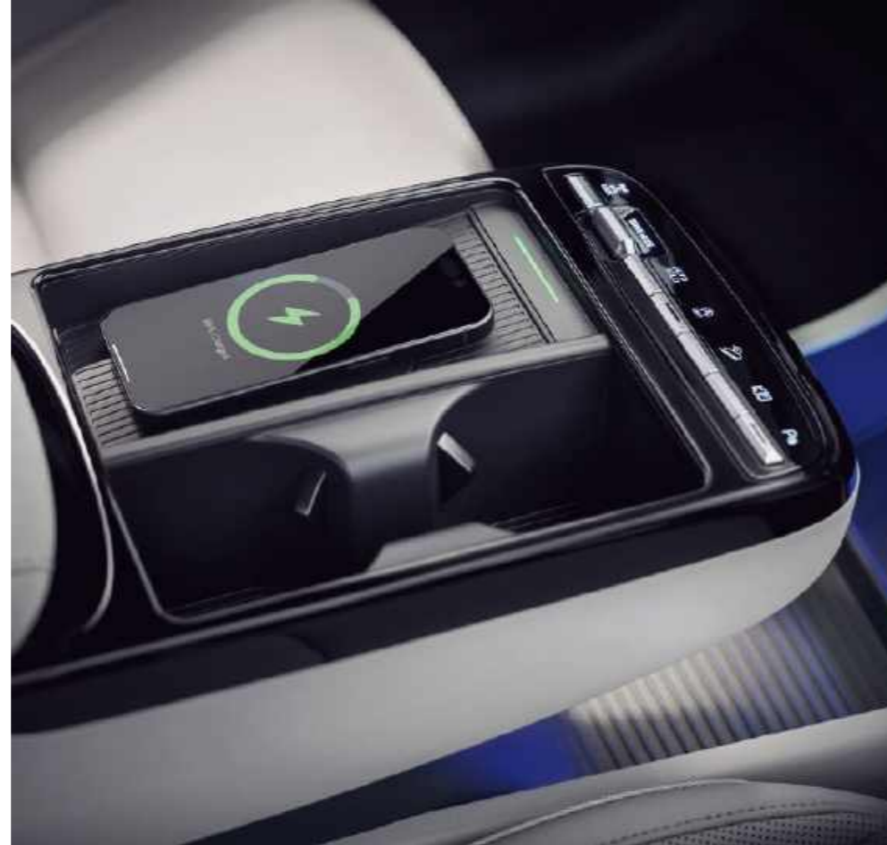
Cargador Inalámbrico (WPC)