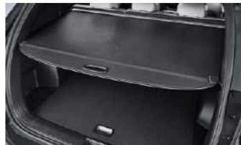
Cobertor de carga retráctil