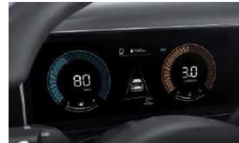
Tablero LCD en color de 4.2 pulgadas