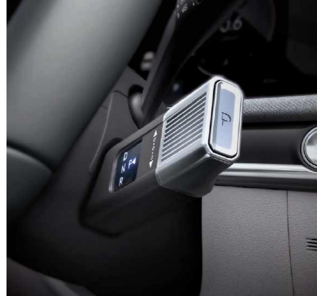
Cambio electrónico tipo columna (SBW)