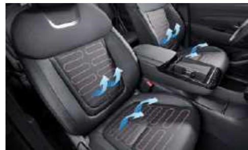
Asientos delanteros con calefacción y ventilación