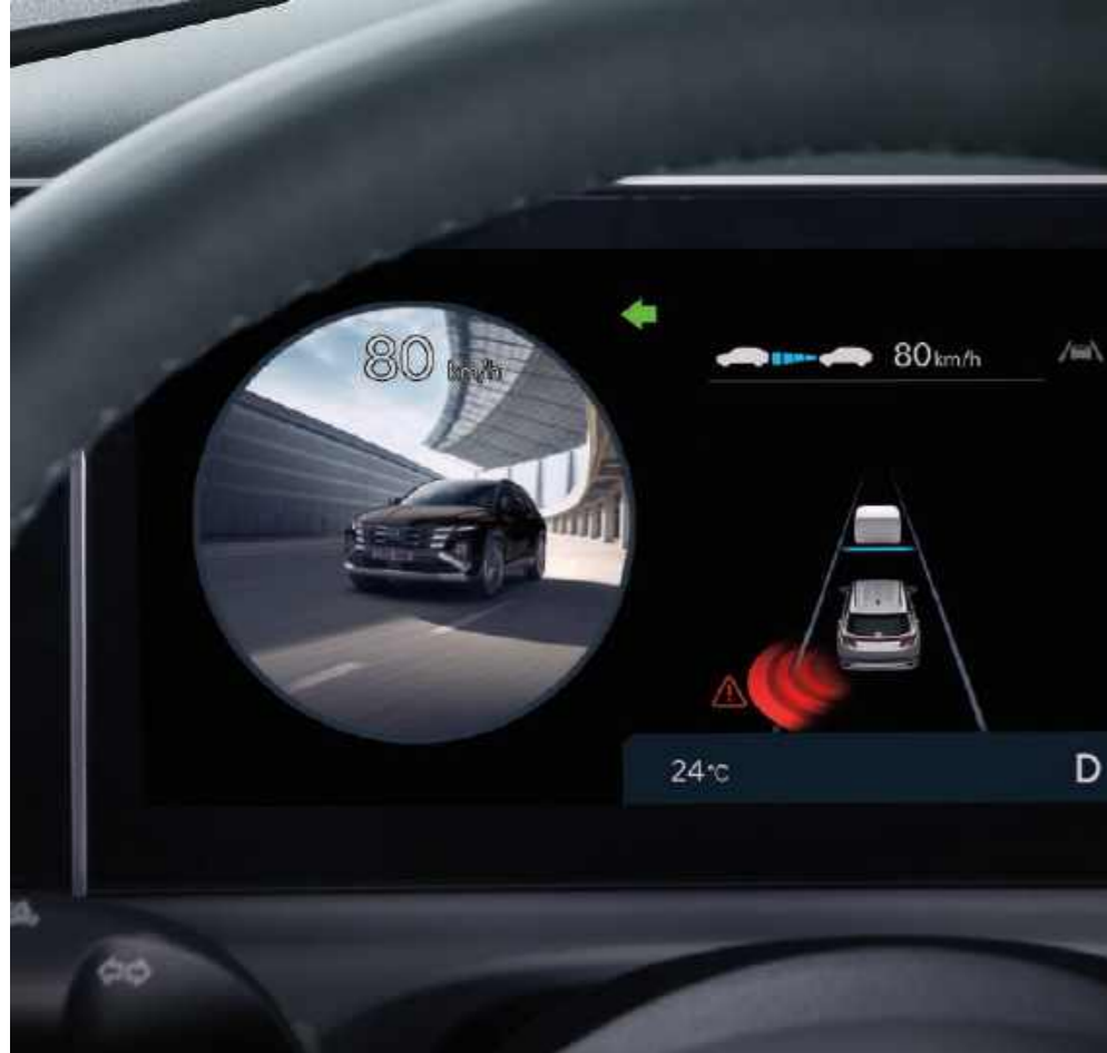
Asistente de puntos ciegos (BVM)

El nuevo TUCSON está repleto de funcionalidades para protegerle de lo inesperado y asegurarle de que no se olvide de nadie.