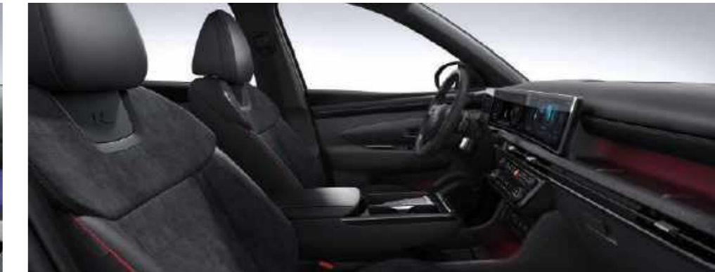
Negro en un tono gamuzado+Cuero con costuras rojas