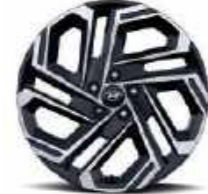
Llantas de aleación de 19" (Opcional)