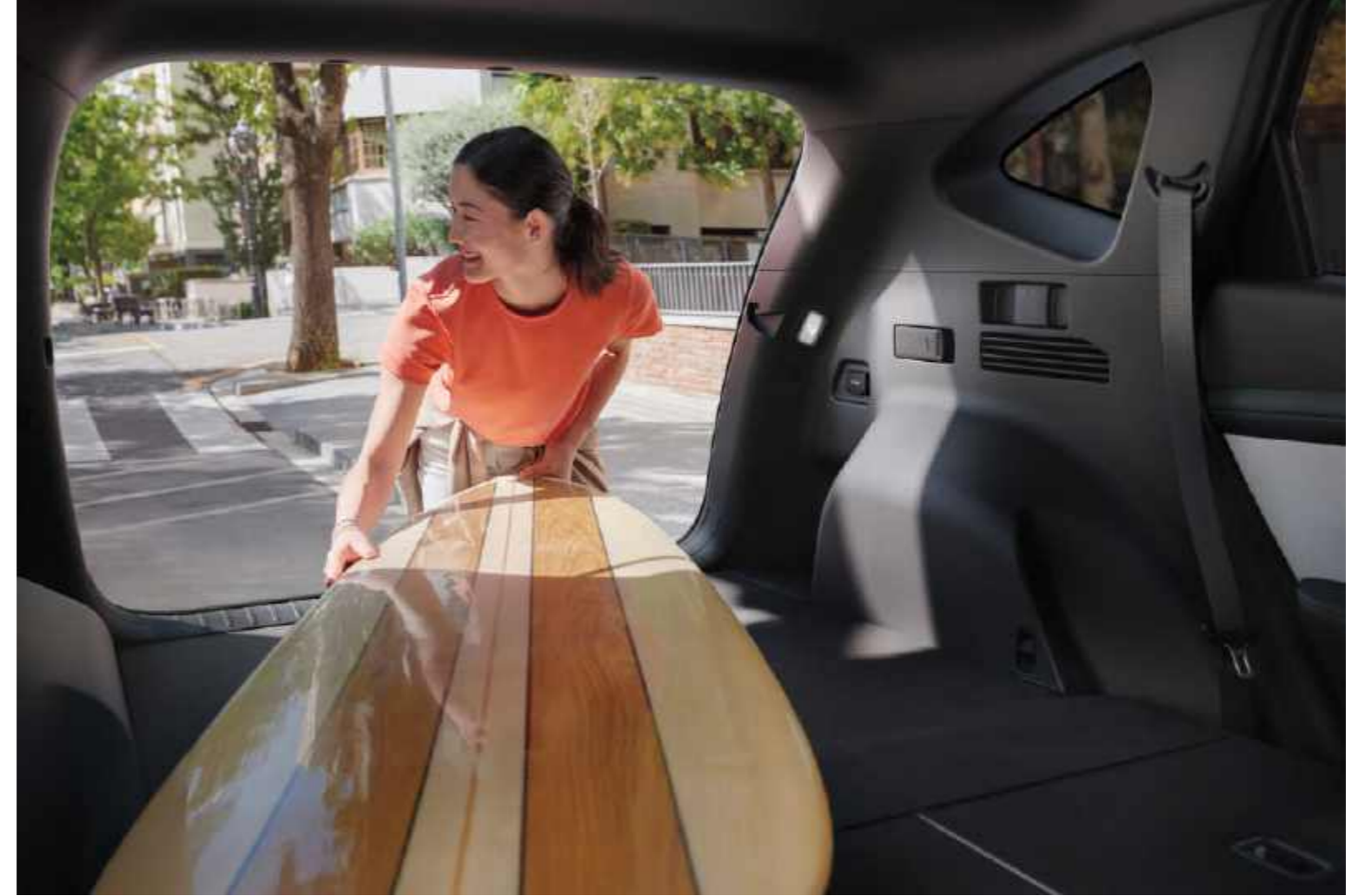
Asientos plegables / Sistema de plegado remoto