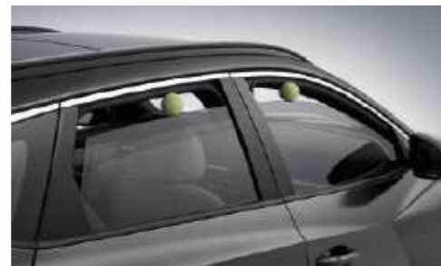
Ventanas eléctricas con función antipinzamiento