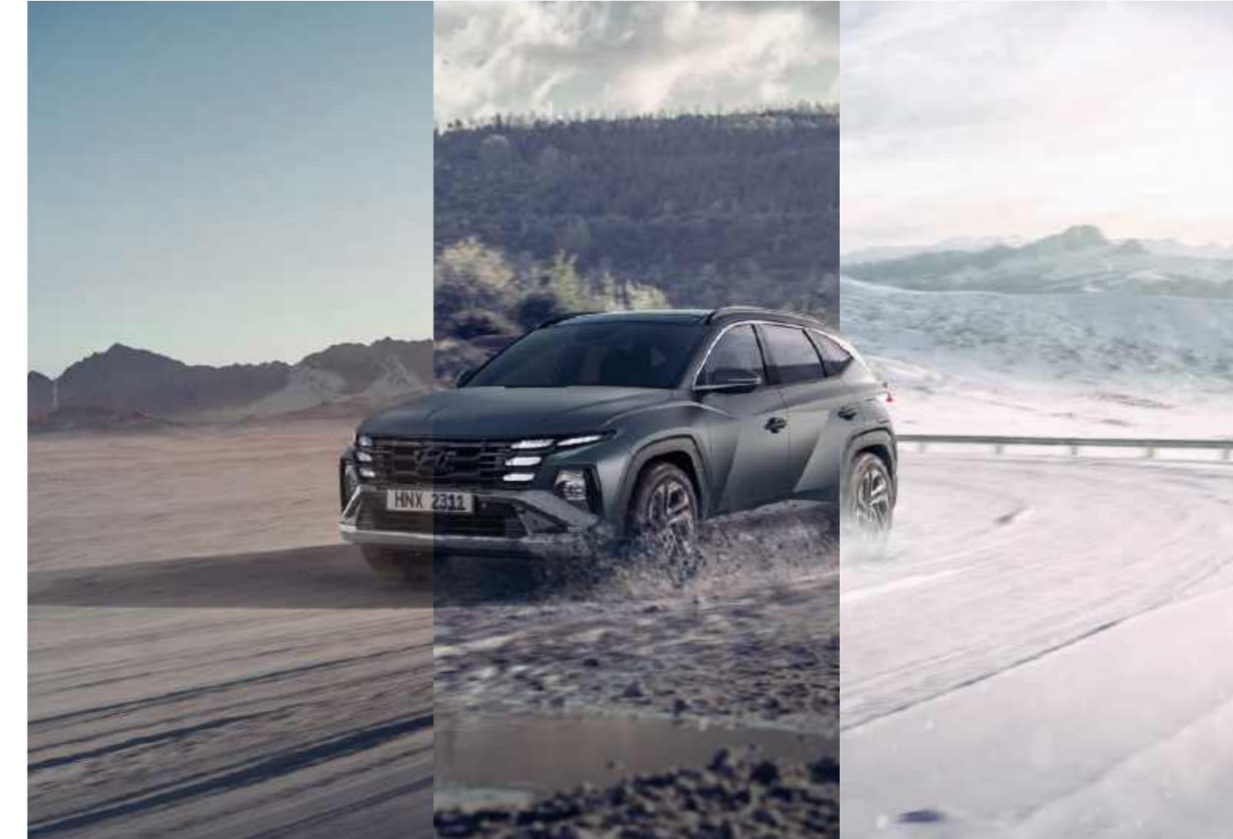
(4WD) HTRAC sistema de tracción total en las 4 ruedas / Modo Terreno (arena, barro, nieve)

TUCSON con tracción total proporciona un excelente rendimiento con la distribución activa de la fuerza motriz entre las ruedas delanteras y traseras en función de las distintas situaciones de manejo.