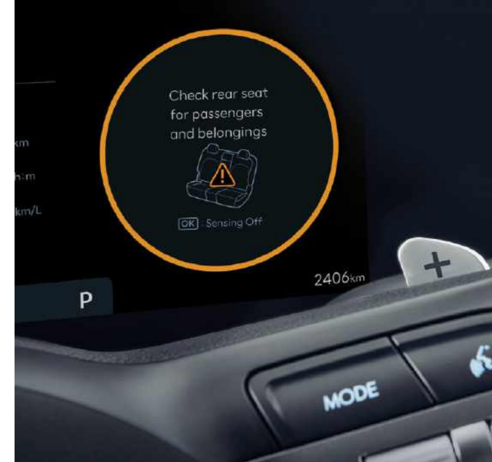
Alerta de ocupantes traseros (ROA)