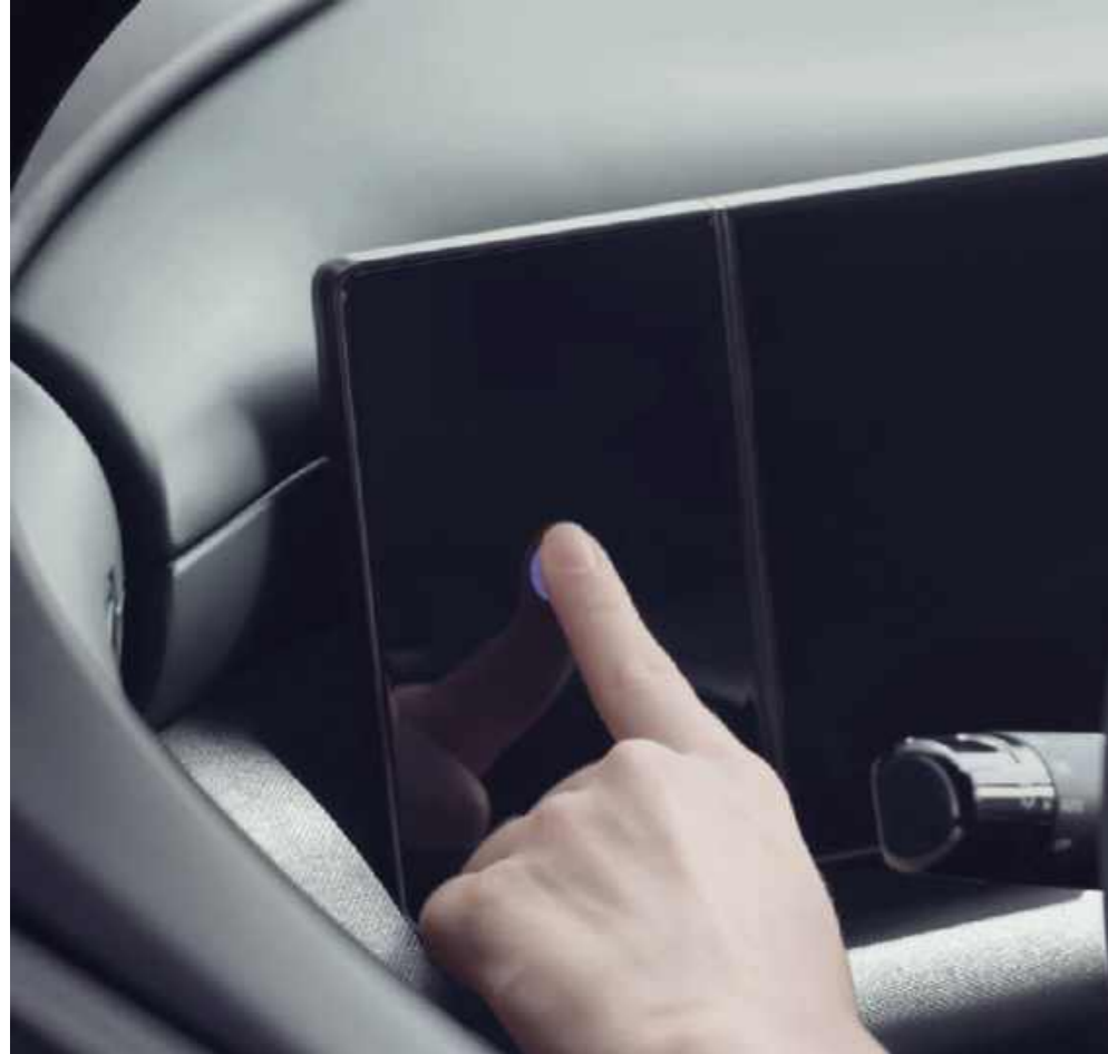
Autenticación por huella dactilar

Un diseño reinventado con tecnologías intuitivas que permiten una cómoda experiencia de manejo sin complicaciones.