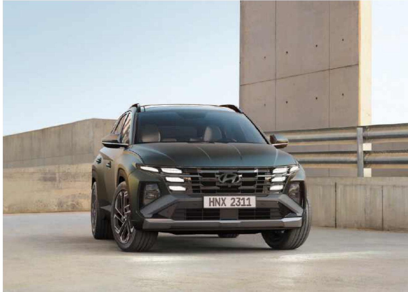
Faros de diseño ocultos en forma de joya paramétrica / Parrilla del radiador / Parachoques delantero

Salga de lo común con elementos atractivos, como en los faros delanteros en forma de joya y en las laterales, actualizados audazmente para permitirle destacarse en la multitud.